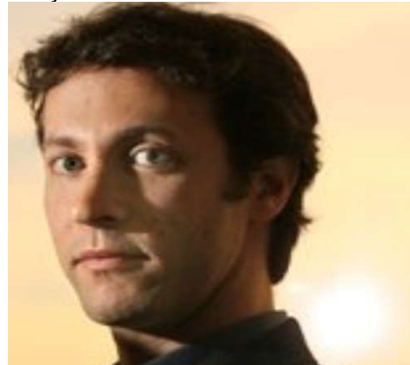
David Eagleman Adjunct professor of Psychiatry & Behavioral Sciences